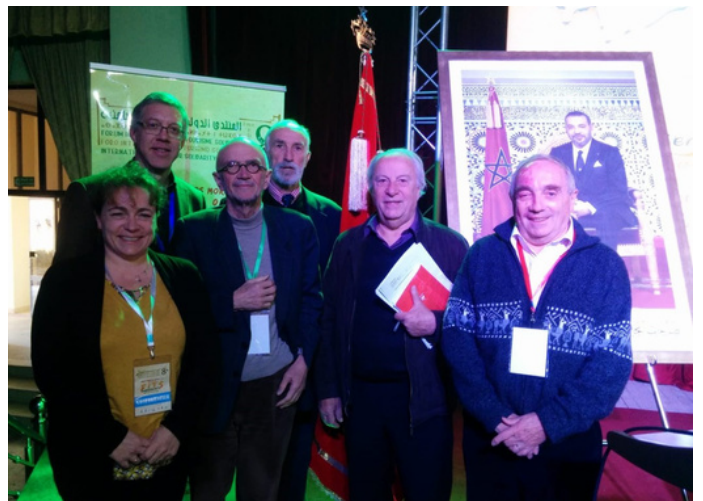
Présentation du recueil de tourisme responsable et solidaire lors du FITS 2020.