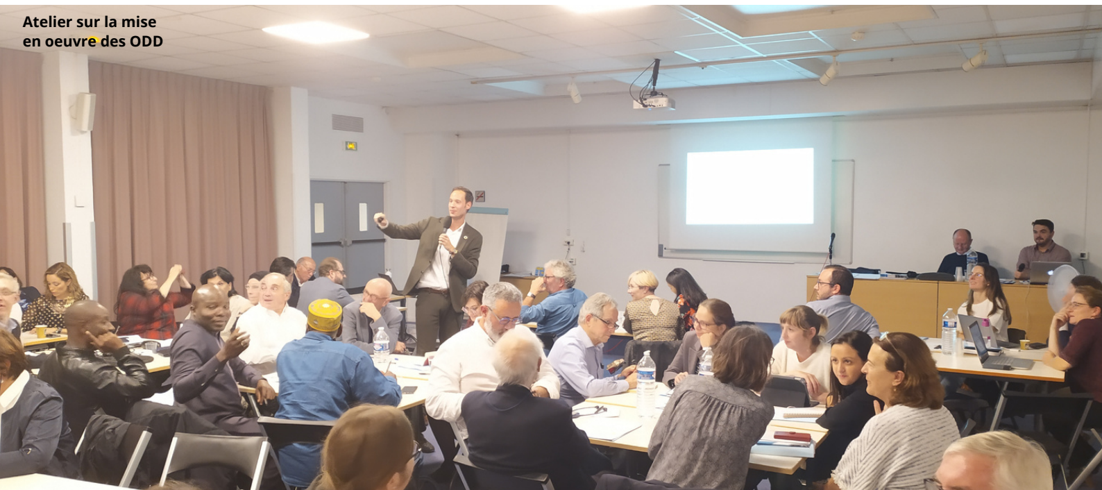
Atelier sur la mise en œuvre des ODD

Parmi les temps forts de ces rencontres - au-delà des questions budgétaires - il y a eu l'atelier animé par un expert sur la mise en œuvre des ODD, la présentation des travaux réalisés dans le cadre de la Commission des politiques sociales du tourisme, la présentation des objectifs et actions prévues pour la 1 ère Semaine internationale du tourisme pour tous, durable et solidaire ainsi qu'une présentation du prochain Congrès mondial programmé au Pérou en 2020.