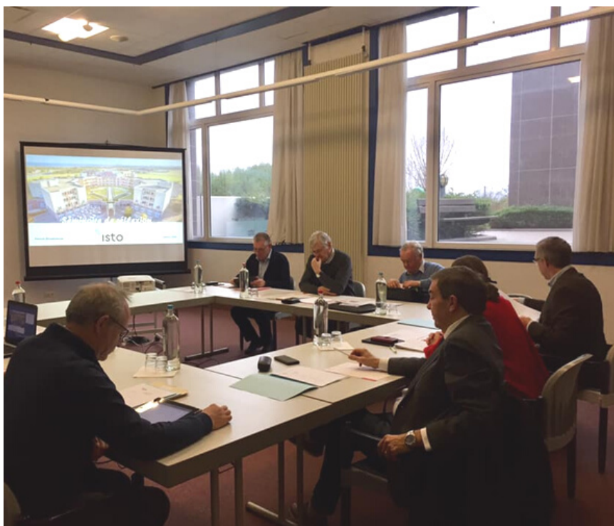
Séminaire de réflexion - janvier 2020