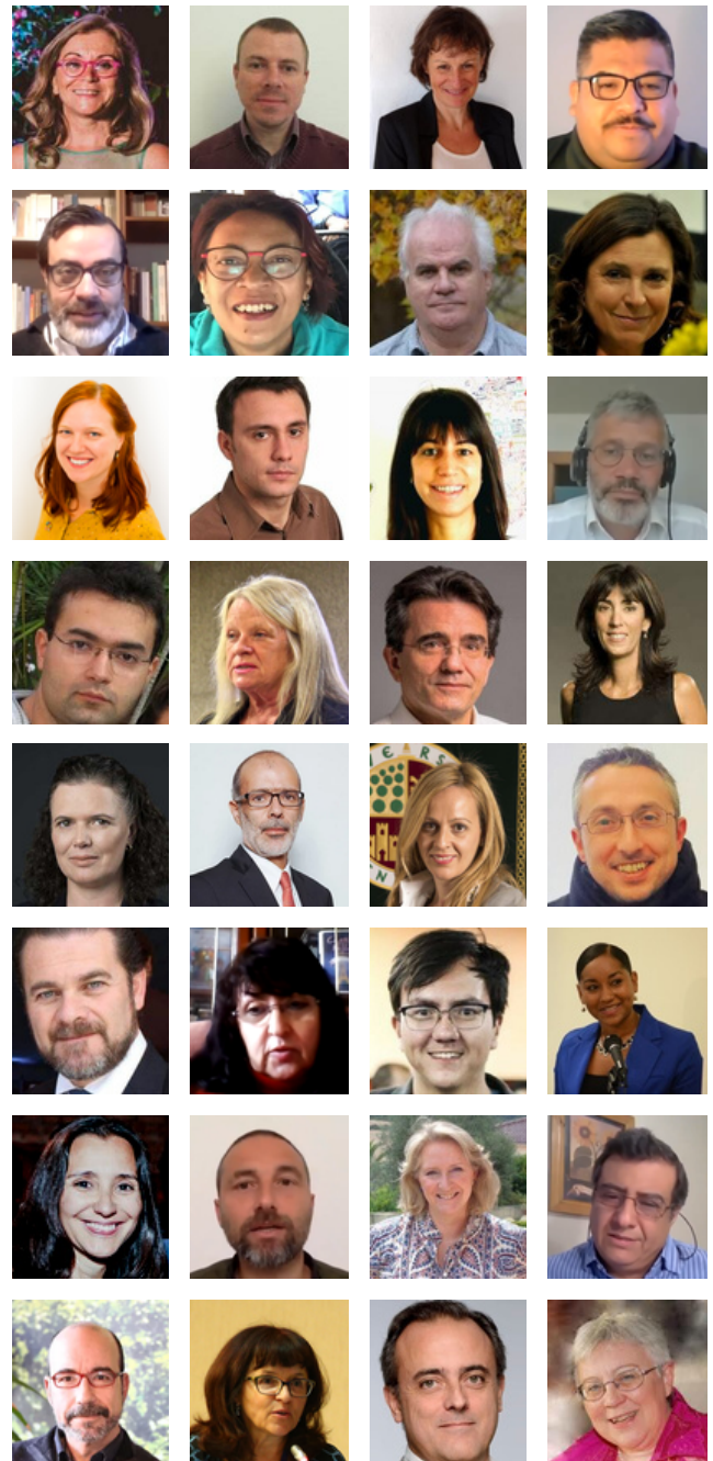
32 des intervenants aux webinaires de la Semaine virtuelle

Pour finir, les webinaires sur « la vision des Amériques », sur le tourisme domestique et sur le rôle des autorités publiques ont plus que jamais insisté sur l'importance du tourisme pour tous, durable et solidaire comme outil de relance des économies locales.