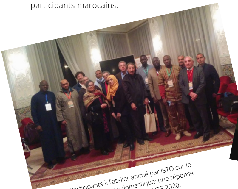
Participants à l'atelier animé par ISTO sur le thème "Tourisme domestique: une réponse au défi climatique ?" lors du FITS 2020.