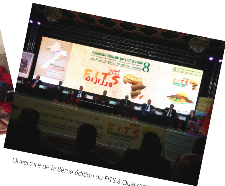
Ouverture de la 8ème édition du FITS à Ouarzazate au Maroc.